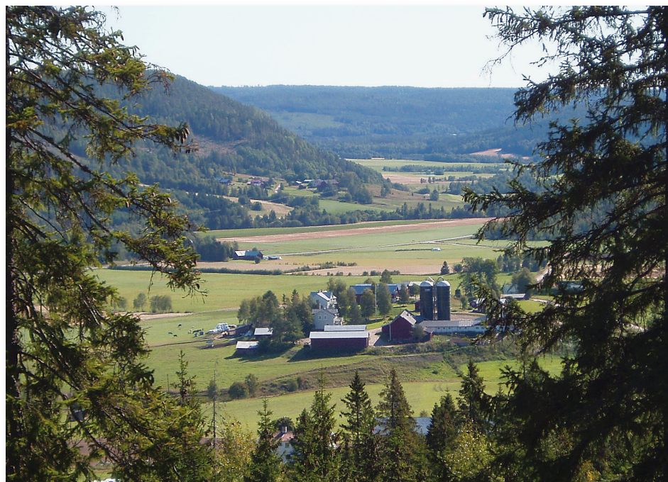
Utsikt österut i Ljustorpsdalen på väg upp på berget vid punkt 4.

1. Lokalisera informationstavlan vid starten. Följ pilen och gul stigmarkering. Den första delen av stigen går över ett hygge som börjar växa upp.