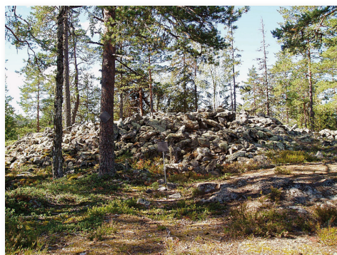
Stenröset, Lövbergskyrkan

3. Fototillfälle. Vänd dig om här och ta ett eget vykort över dalen. Här uppe på hållarna kan hitta den sällsynta, vackra växten Bergglim. Den är lågt växande och vit.