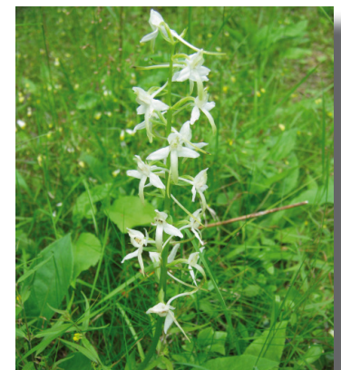
Orkidén Nattviol