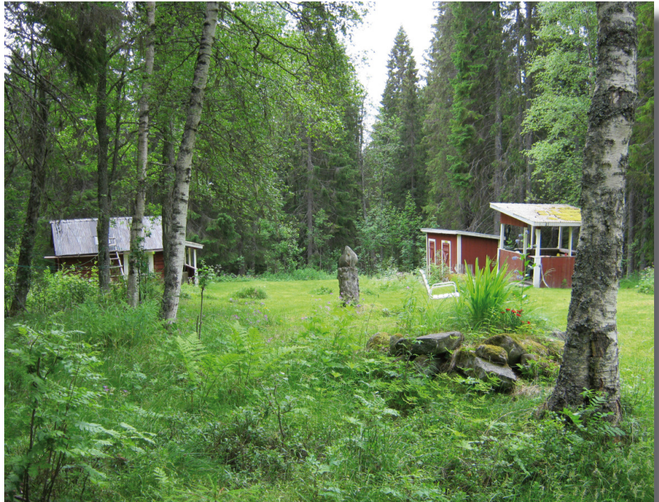
Fuske fäbodlar med raststuga och utedass

Bönderna brukade fäbodlar för att inte korna skulle beta av de foder som skulle bärgas för vintersäsongen. Redan vid 12 års ålder började man lära upp flickorna till att vara fäbodtjänor. Ågarens dot-