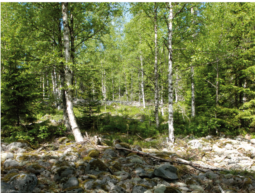
Klapperstensfält vid Bräntberget