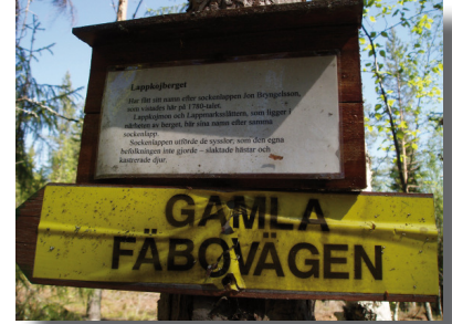
Skylt efter stigen

Lappkojberget i området har fått sitt namn från sockenlappen Jon Bryngelson, som vistades här. Sockenlappen utförde de sysslor som de andra inte ville