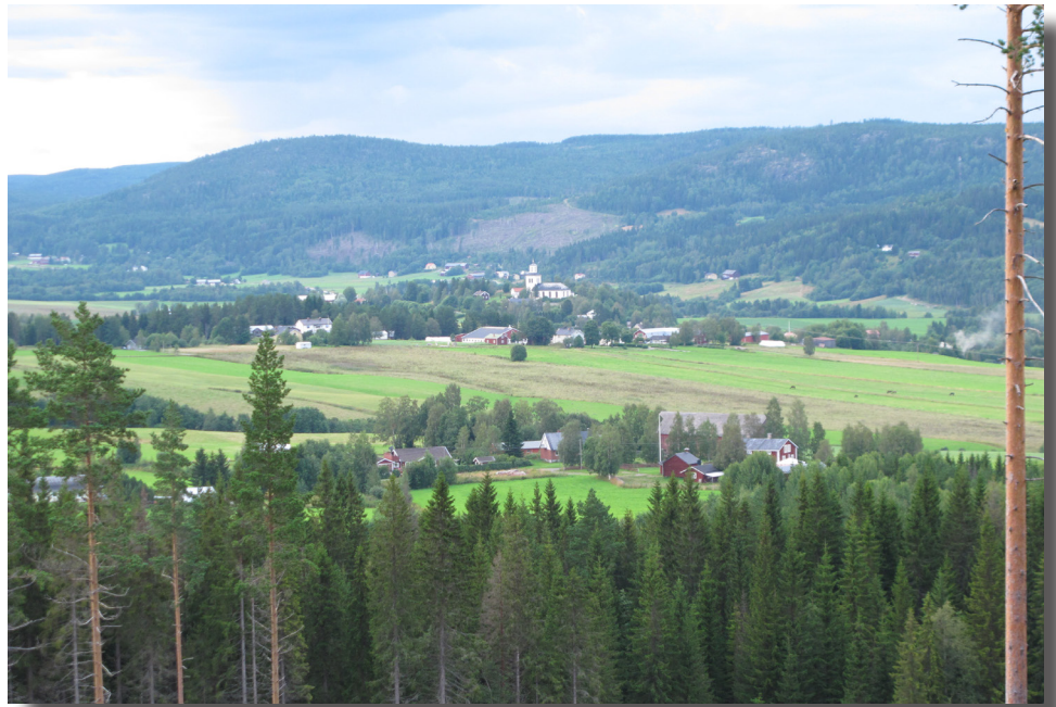
Utsikt över dalen efter ett hygge strax efter Delldéns

Vi vet att Västra Frötuna fäbodlar var byallmänning på 1700-talet. Det var därför naturligt att alla bönder i Frötuna