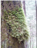
Aspfjädermossa som kan hittas efter stigen.

En kuperad stig med historiska anor. Stigen går från Tuna by till fäbodarna öster om Mjällån, men delar är idag på vissa sträckor ersatt av skogsbilväg och starten sker idag där stigen tar vid. Du kan välja flera olika turer efter leden beroende på om du vill gå långt eller kort. En mycket populär sträcka är att gå mellan broarna, dvs från Petter Norbergsbron till Jällviksbron. Efter stigen finns en kalkkälla, fångstgropar och en geocache. Stigen kan kombineras med flottarstigen som gör stigen till en rundslinga.