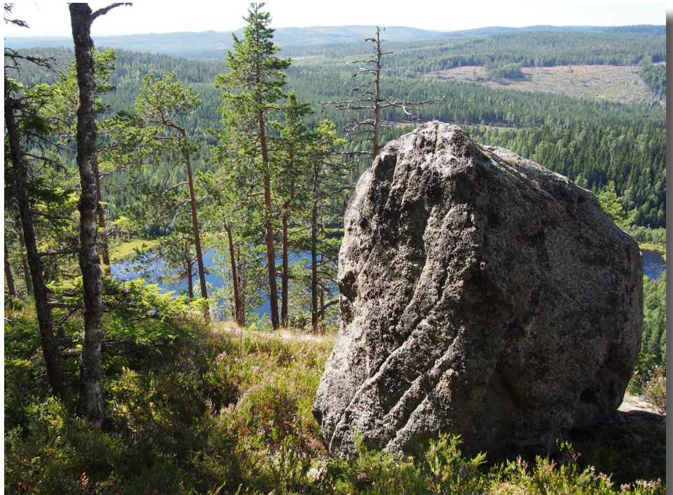
Klippblocket på toppen med Prästtjärnen i bakgrunden.

Prästboställets fäbodpar låg på en höjd intill Prästtjärnen. Här har i alla tider berättats om allsköns spökerier och att fäbodvallen återuppstår vid midnatt på midsommarafton. Det har berättats om råmande kor, pratande