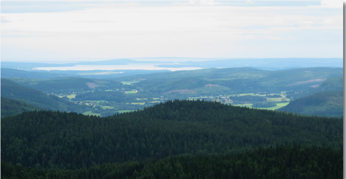
Utsikt från Högåstornet mot centrala Ljustorp och havet

Högåstornet är som det låter ett torn på Högåsen i Fuske. Upp till Högåsen går du en kort stig från en vändplan i Lögdö vildmark. Stigen upp går över ett hygge med fantastiskt fin utsikt över Ljustorpsdalen och Lögdö vildmark. Väl uppe på Högåsen kan du gå upp i utsiktstornet och besöka den öppna brandbevakarstugan. Höjden på tornet är cirka 18 meter och man får en fantastisk utsikt. Tornet är privatägt, men man får gå upp på eget ansvar. Upp i tornet har du en utsikt från Härnösand till Hälsingland.