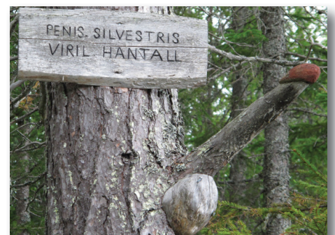
1. Pinus sylvestris = tall på latin.