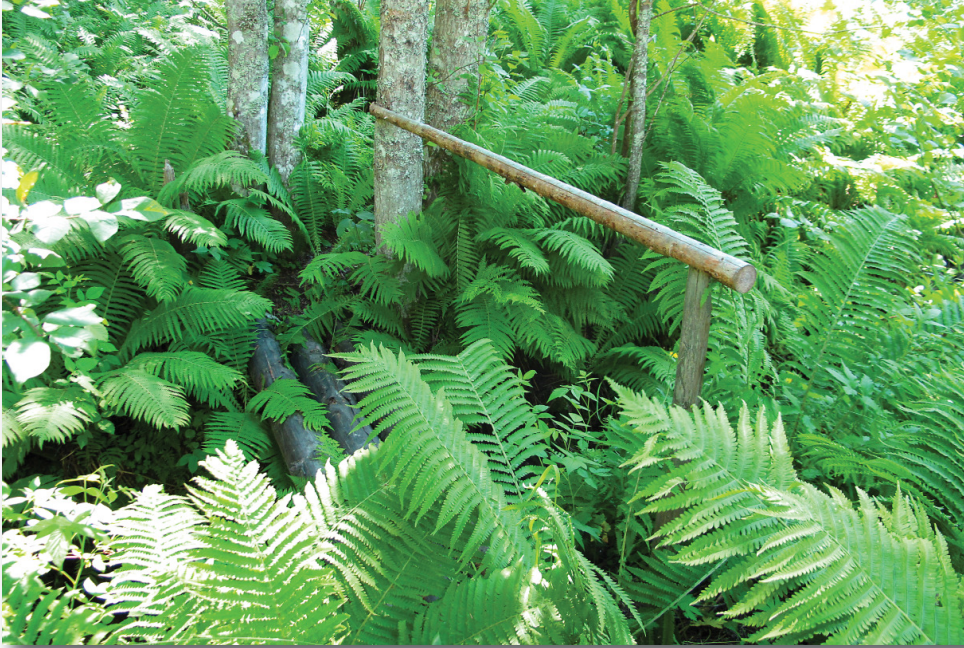
Bron över den slingrande bäcken vid Petrus Nybergsnäset

Flottarstigen går på östra sidan av Mjällån och du vandrar genom ett vackert landskap format av Mjällån genom årtusenden. Här vandrar du efter den gamla flottleden. Du passerar nipor, en kalkkälla och du går genom en osedvanligt speciell natur med ovanlig växlighet. Stigen består i sin fulla längd av fyra delar, men det är bara den här delen som hitills är lättvandrad och uppskyttad.