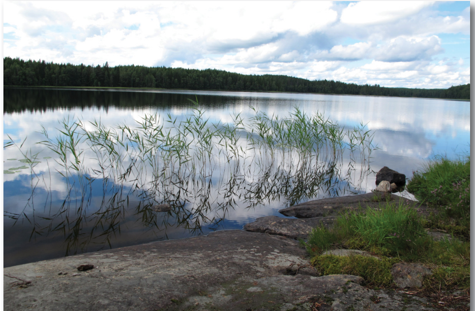
Utsikt från grillplatsen på Nätholmen

Janne Vängman är en litterär gestalt baserad på en verklig person. Böckerna skrevs av JR Sundström. Janne Vängmans sällskapet är ett litterärt sällskap som 1978 bildades i Risnäs, (ungefär 2,5 mil utanför Härnösand). Sällskapet har till syfte att bevara och vidareut-