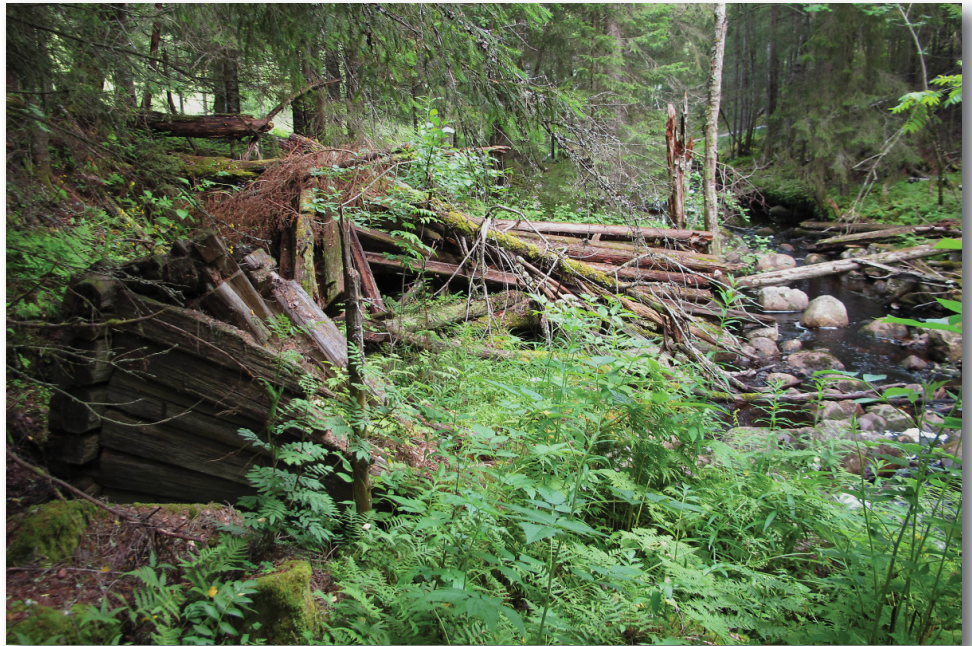
Trösklogen med kvarn och spånhyvel, tillhörde torpet Öppom 5:5

Beskrivningen gäller om du går den längre slingan över Gluptjärnen och avslutar med slingan runt området 9,6 km