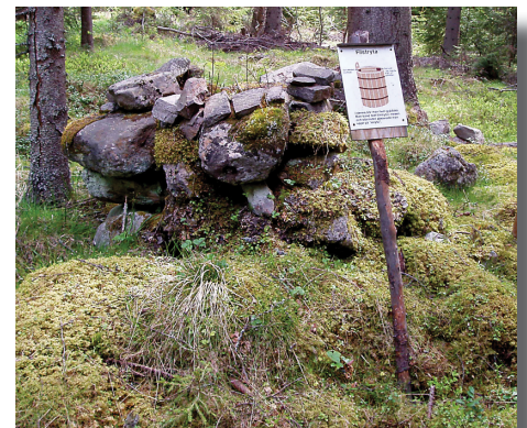
Lämning på Björkoms fäbod

8. När du är tillbaka vid bilen så rekommenderar vi att du går ner till badplatsen och tar ett dopp. Röjesjön är en ypperlig plats för kvallsdopp. Då har du kvällsolen mitt emot badplatsen. Vattnet i sjön är av bra kvalitet och blir ofta fort badvarmt. Det är dessutom sandstrand och fin sandbotten.