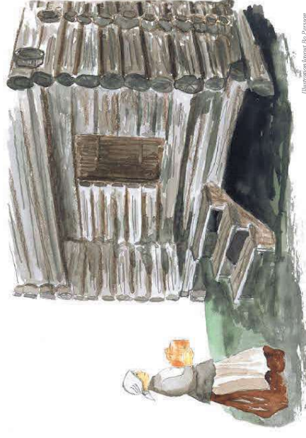
Illustration: Helena Br. Persson

Denna fåbod är möjlig att besöka också för dig som är rörelsehindrad.