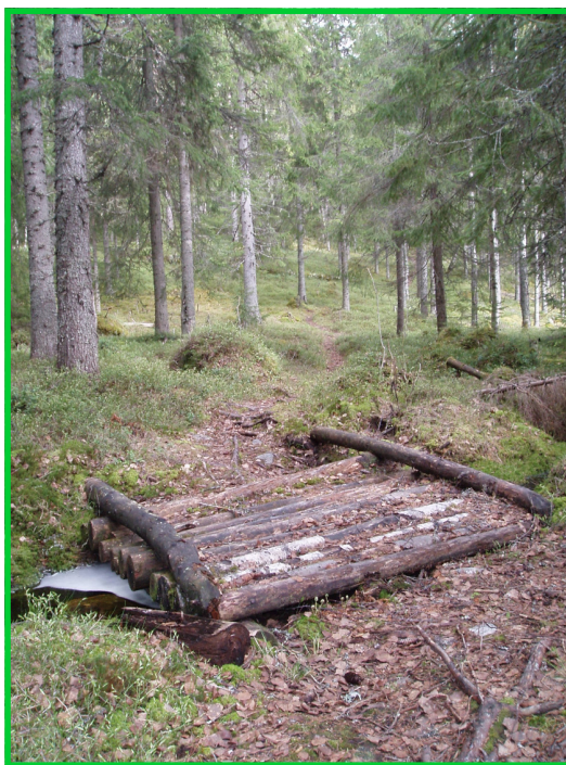
Material och karta: "Sevärt i Timrås natur"

Cirka 2 kilometer väster om Röjesjön ligger Svartåsen, en av de få urskogar som finns kvar i Ljustorp. Skogen ägs av kyrkan och ska sparas som gammelskog.