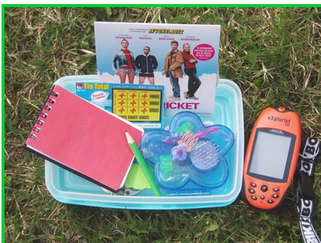
Text och foto: Lena Liljemark.

tar något ur gömman ska man lägga dit något istället.